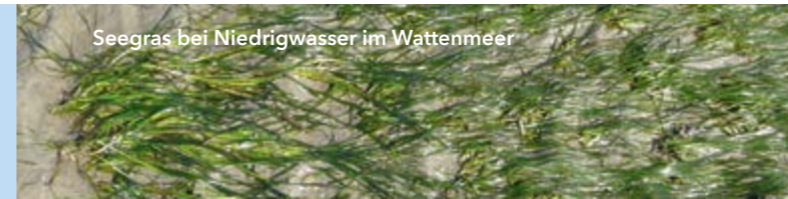
Seegras bei Niedrigwasser im Wattenmeer