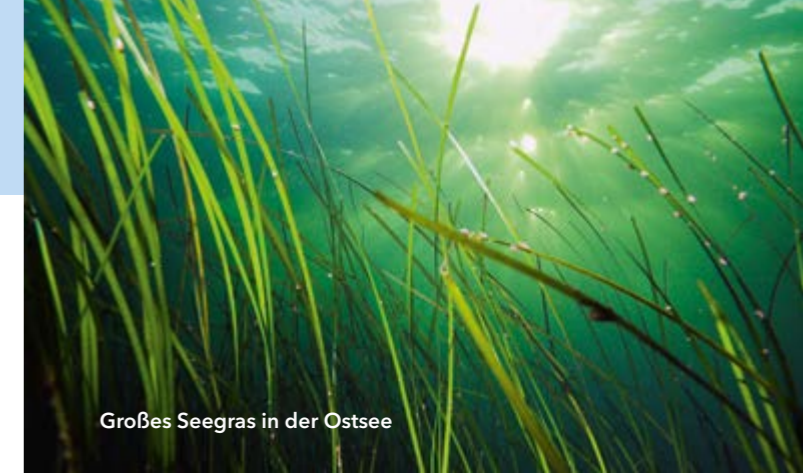
Großes Seegras in der Ostsee