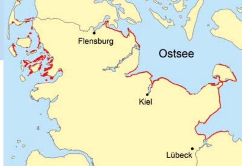
Verbreitung des Großen Seegrases

Bei Fragen wenden Sie sich bitte an das Landesamt für Landwirtschaft, Umwelt und ländliche Räume